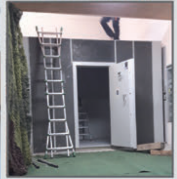
Waffenräume - Tresorräume Schutzräume - Modularräume