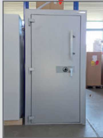
Waffenraumtüren sofort ab Lager Nürnberg