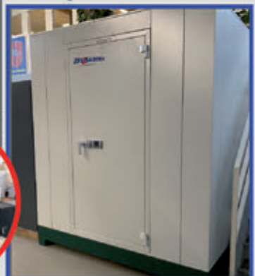
Original modularer Waffenraum in unserer Ausstellung Nürnberg