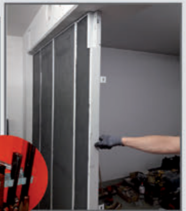
Aufrüstung von Räumen zu gleichwertigen Waffenräumen